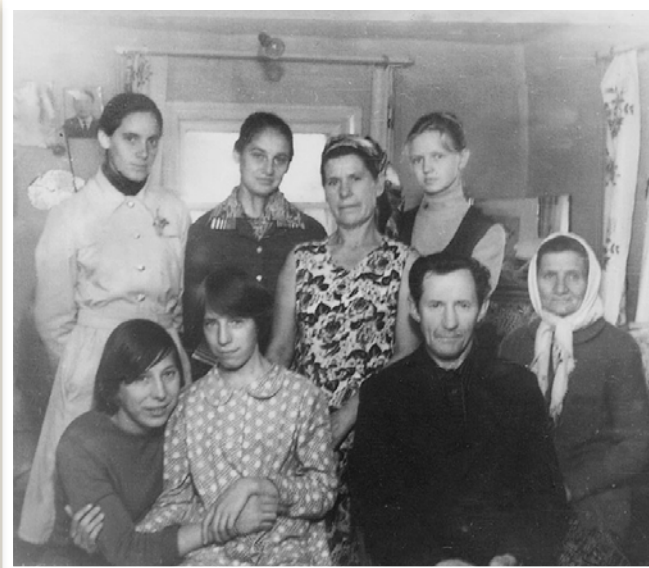
С молодёжью Анжеро-Судженска, 1978 г.