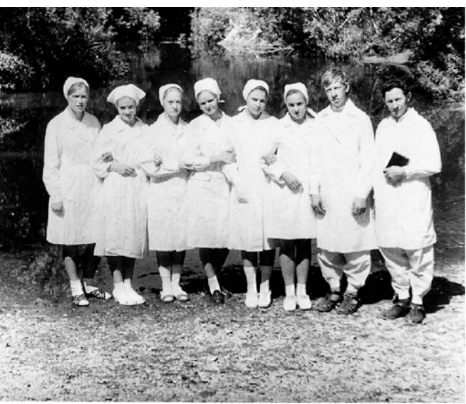
Крещение, 1977 г.

Часто во время богослужения дружинники устраивали