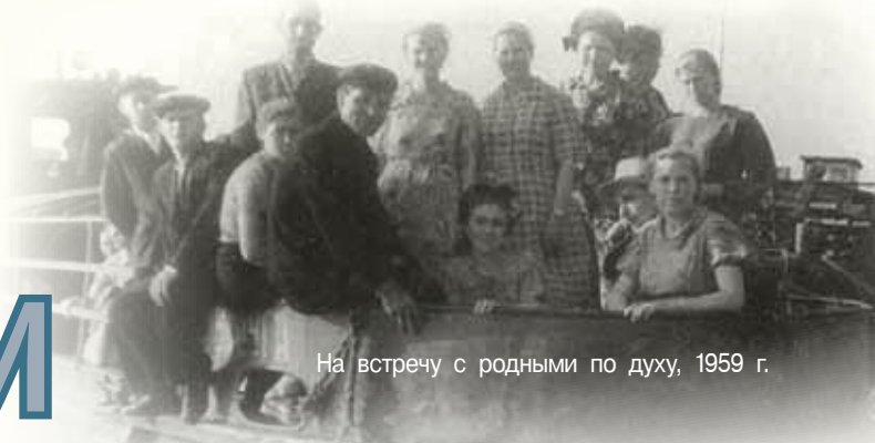
На встречу с родными по духу, 1959 г.