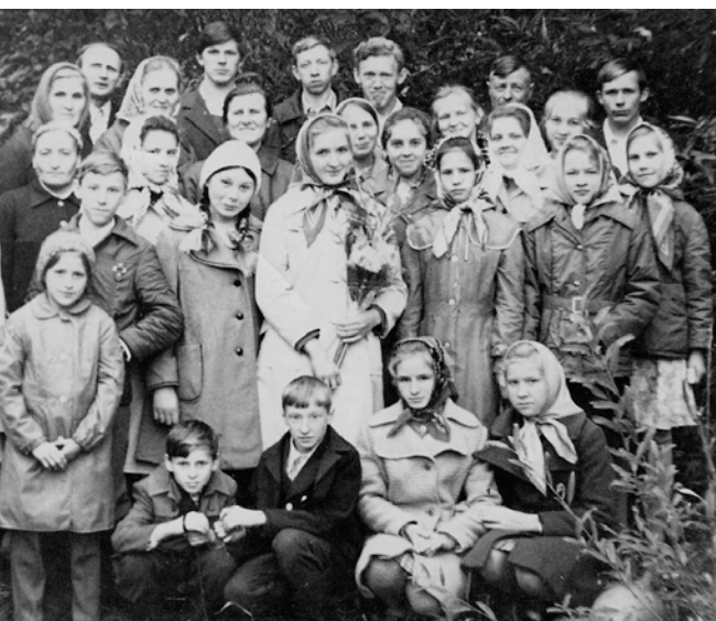
Томская молодёжь, начало 80-х гг.

В напряжённые годы притеснённой церковью помнила о своём главном предназначении — рассказывать людям о спасении во Христе. Правда, совершалось благовестие скромно, в соответствии с условиями того времени. Братья использовали свои производственные отпуска, чтобы посещать места, где, как они слышали, есть кто-то из верующих (в основном это были сосланные в тридцатые