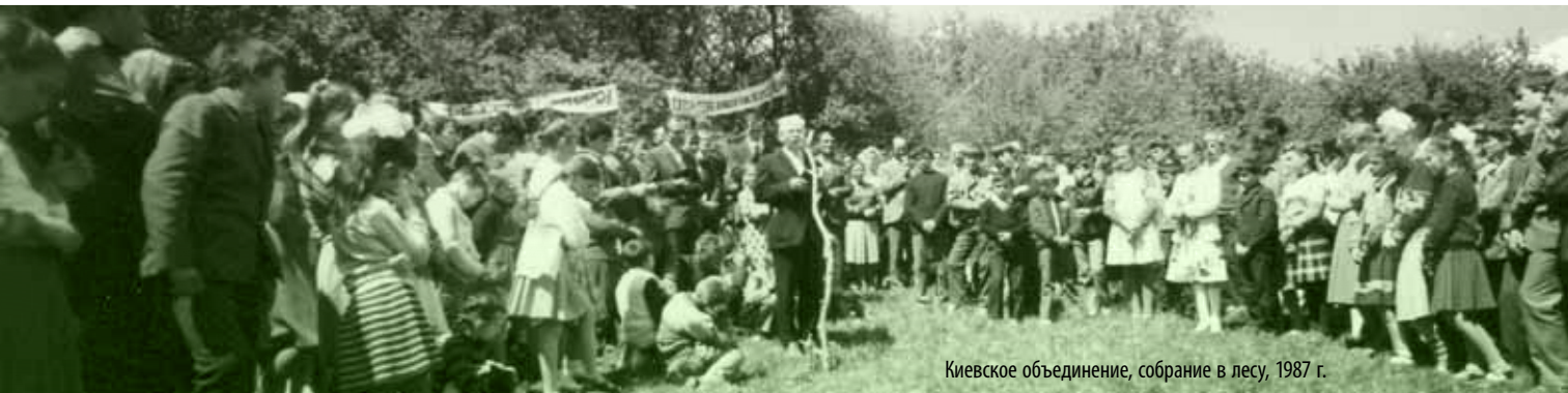
Киевское объединение, собрание в лесу, 1987 г.