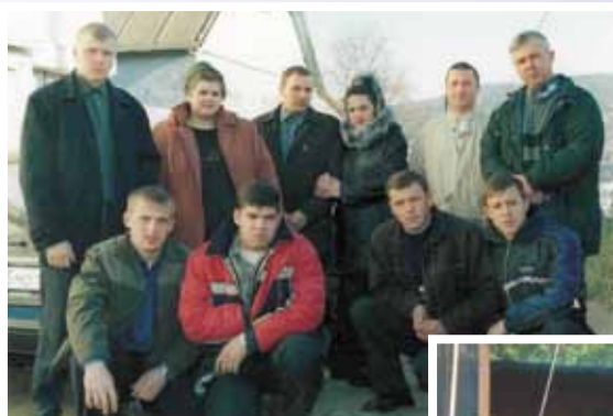
С верующими Магадана, 2005 г.