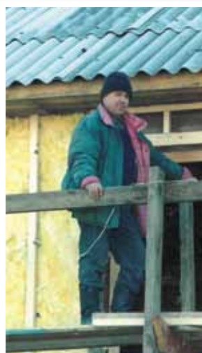
Строительство Дома молитвы в Магадане, 2004 г.

В день похорон южное солнце не пряталось за облаками. Внимательному сердцу оно напоминало о том, что Божья нива на самом деле побелела и поспела к жатве. Кто сегодня услышит зов Господина жатвы и охотно откликнется — отдаст себя на служение ближним, став светильником горящим и светящим?! ■