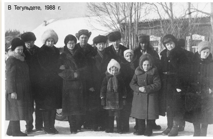
В Тегульдете, 1988 г.

годы или их дети), разыскивали их, проводили там собрания, на которые приглашали их родственников и соседей.