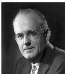
Эйден Уилсон Тозер (1897–1963) — американский пастор, проповедник, автор более шестидесяти книг