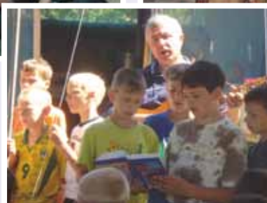
В детском лагере, 2006 г.