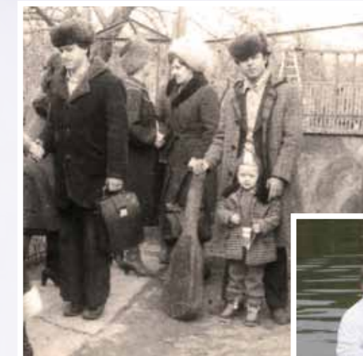
После суда, 1983 г.