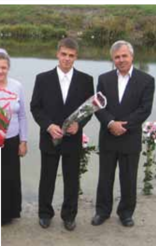
Двое детей принимают крещение, 2007 г.